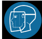
Helm, met gelaatscherm of soortgelijk