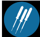
Kortsluitvast beveiligde meetpennen