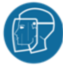
Helm met gelaatscherm