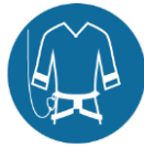
Verticaal valbeveiligingssysteem bij klimmen boven 2,5 m