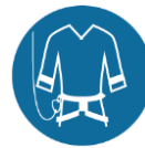
Valbeveiliging/klimharnas bij werken op hoogte of op steigers boven 2,5 m