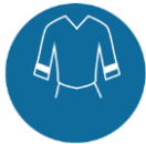
Hoge zichtbaarheid veiligheidskleding