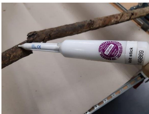
onjuiste locatie voor meten met volstick