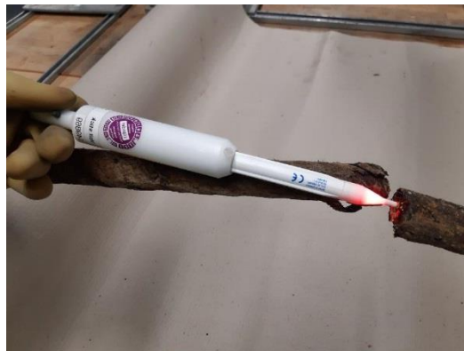
juiste locatie voor meten met volstick