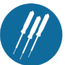
Kortsluitvast beveiligde meetpennen