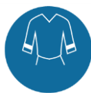
Hoge- zichtbaarheid veiligheidskleding