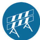
Kettingen en afzettingen