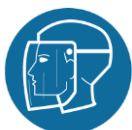
Helm met gelaatscherm of soortgelijke