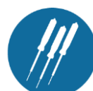
Kortsluitvast beveiligde meetpennen