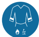
Antistatische en vlamvertragende werkkleding