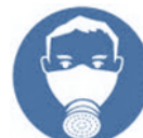
Minimaal halfgelaatsmasker met filterend gelaatstuk minimaal A1