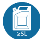
Jerrycan met minimaal 5 liter water