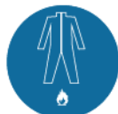
Brandvertragende wegwerpoverall gedragen over de werkkleding en geschikt voor werken met aardgascondensaat