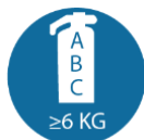
Brandblusser (klasse A/B/C) van minimaal 6 kg