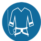
Verticaal valbeveiligingssysteem bij klimmen boven 2,5m