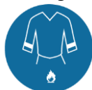
Vlam vertragende veiligheidskleding