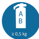
Brandblusser (klasse A/B) van minimaal 0,5 kg