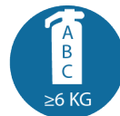
Bij werkzaamheden aan aansluitleidingen: brandblusser (klasse A/B/C) van minimaal 6 kg