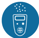
Gassignaleringsapparatuur met akoestisch en optisch signaal