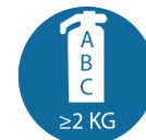
Bij werkzaamheden aan meteropstellingen: brandblusser (klasse A/B/C) van minimaal 2 kg