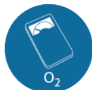
Bij werkzaamheden in een besloten ruimte: zuurstofmeter