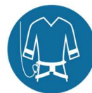
Valbeveiliging/klimharnas bij werken op hoogte of op steigers boven 2,5 m