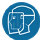
Helm met gelaatscherm of soortgelijke