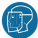
Helm met gelaatscherm of soortgelijke