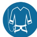
Valbeveiliging/klimharnas bij werken op hoogte of op steigers boven 2,5 m